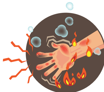
Неосторожное обращение с огнём