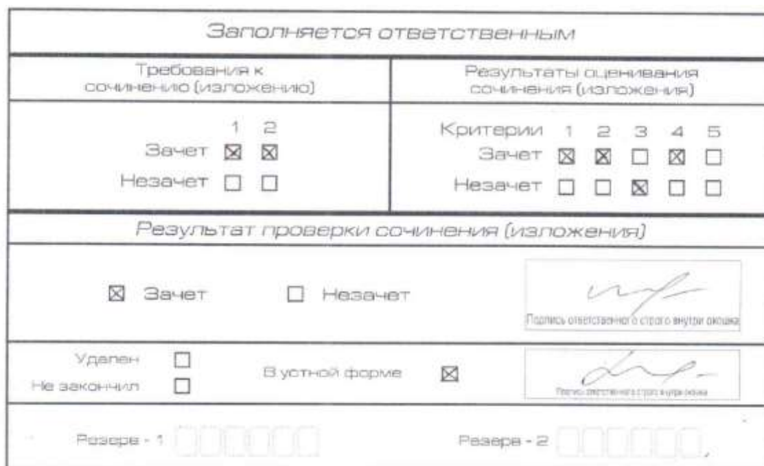
Рис. 10. Область для оценки работы сочинения (изложения) в устной форме